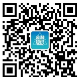
金融知识微普及二维码