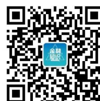
金融知识微普及微信公众号